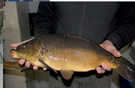
Auch Spiegelkarpfen werden küchenfertig zubereitet

den Karpfen, Forellen und Schleien, der Verarbeitungstisch, die Kühltruhen. Fisch von Bauer gibt es auch im Hofladen der Agrargenossenschaft im nicht weit entfernten Kauern (samt des Kuh-Cafés mit Panoramablick auf den modernen Kuhstall). Und er versorgt mehrere Gaststätten, etwa das Zwergenschlösschen in Untermhaus.