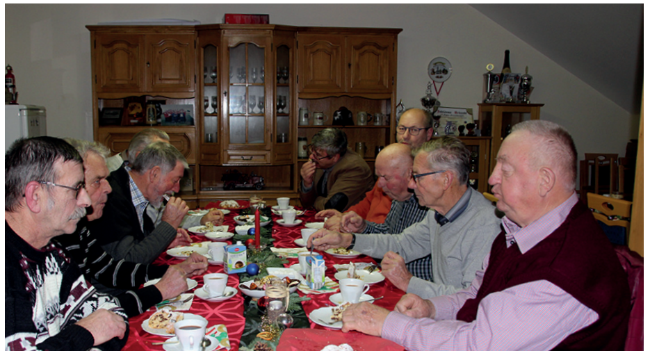
Nach der Besichtigung der Anlage traf man sich im Feuerwehrgerätehaus.